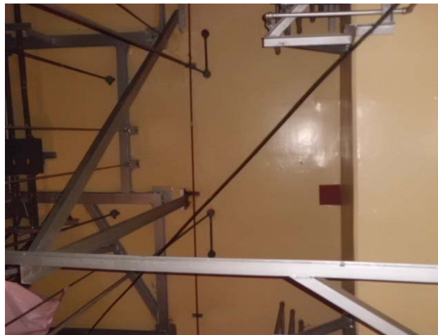
使用済燃料プール床（H23.5.21撮影、下階からの見上げ）

*福島第一原子力発電所の原子炉建屋の現状の耐震安全性および補強等に関する検討に係る報告書（その1） （平成23年5月28日 東京電力（株））