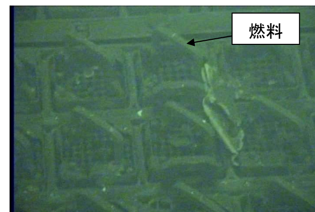
使用済燃料プール内の様子(2/9撮影)