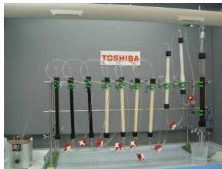
図 試験装置（吸着材充填済）