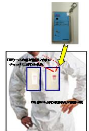
図 4 胸部分が透明なタイベックイメージ

（※）APD の警報設定値が 3mSv 以上の作業。なお、対象作業の範囲について検討の上、APD を外部から所持確認する方法の検討結果やメーカーの量産体制を確認しながら、対象作業範囲の拡大を検討していく。（今後継続検討）