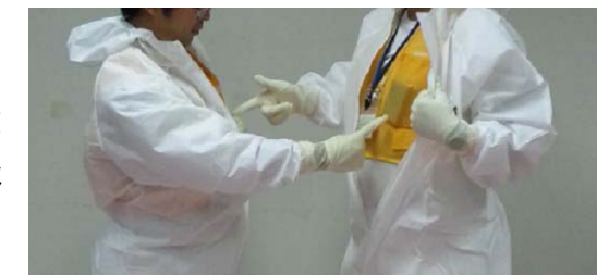
図 3 APD 所持の相互確認イメージ

また、作業件名ごとに APD 持ち忘れ防止対策を作業責任者が自ら定め実施する。実施計画については当社に報告する。（運用中）