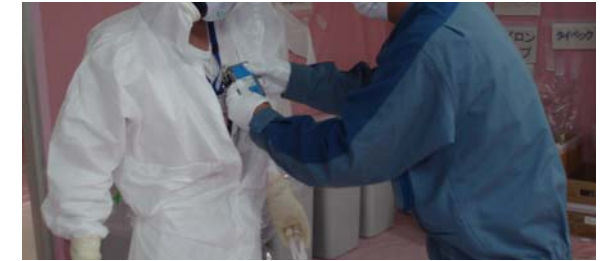
図 2 白タイベック着用者に対する APD 所持確認

免震重要棟、休憩所、正門、および J ヴィレッジにおいて、白タイベック着用者が APD を所持していることを、白タイベックのジッパーを下げることで確認できる場合には目視で、これができない場合には APD を収納した箇所を作業員に確認の上その箇所を手で触れることにより当社管理員が確認する。（正門での APD 所持確認は 9 月から実施予定、それ以外の箇所は運用中）