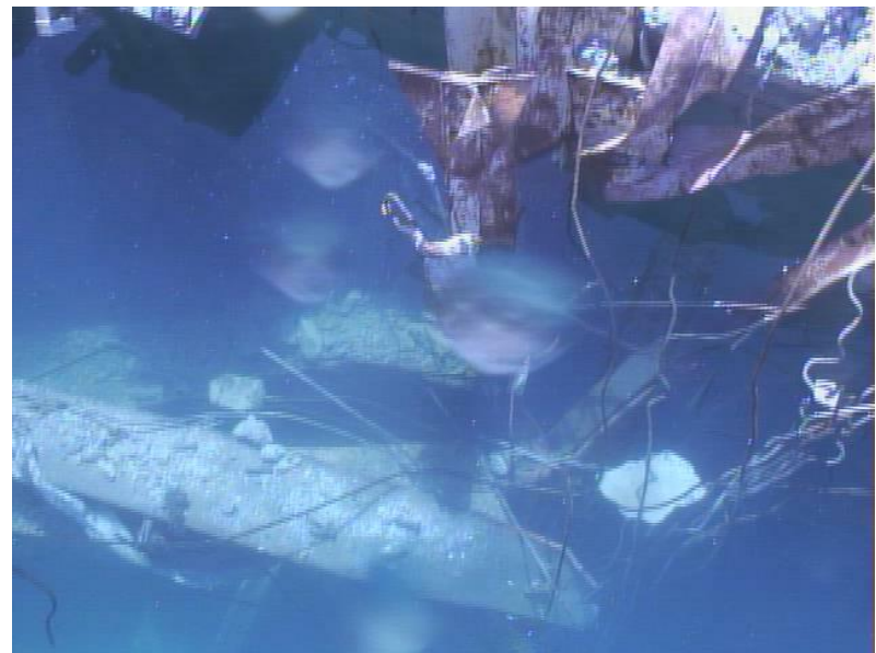
使用済燃料プールガレキ(水面)④