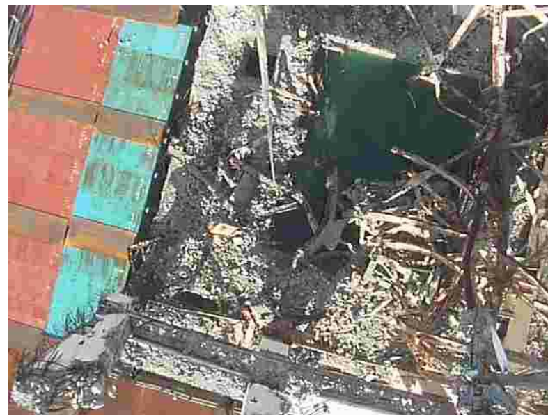
使用済燃料プール全体②