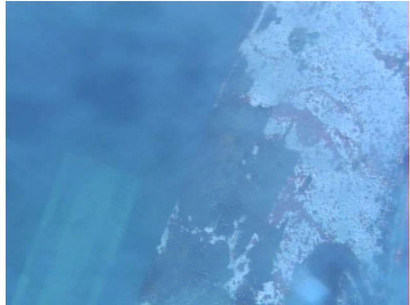
使用済燃料プールガレキ(水中)②