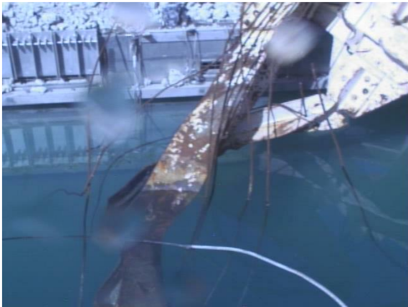
使用済燃料プールガレキ(水面)③