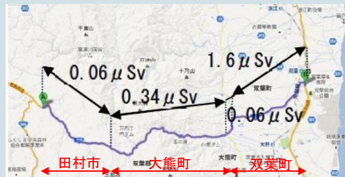
国道288号の被ばく線量

・国道288号は、福島第一原子力発電所の西側に当たるため、避難指示解除準備区域の間は比較的低い空間線量率が継続する。他方、発電所から約10kmの付近から福島第一原子力発電所から北西に広がる汚染地域の中を一部通るため、空間線量率が急増する。また、国道6号との合流点についても高汚染地域のバンドから外れるために低下する。