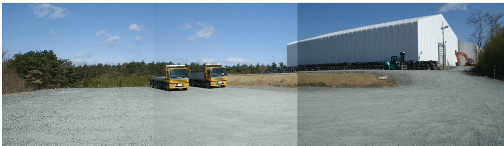
一時保管エリアB(3月21日撮影)