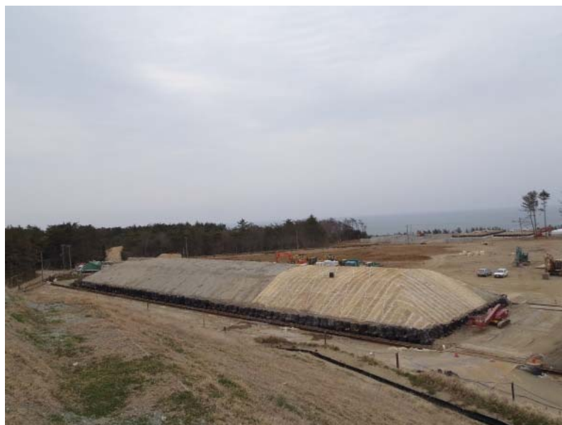
2 槽目の状況 (3/25撮影)