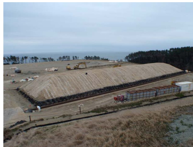
1 槽目の状況 (3/27撮影)