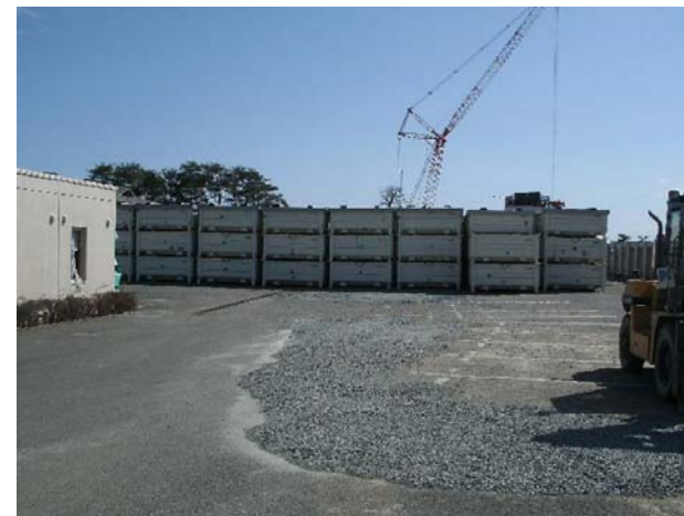
一時保管エリアQ(3月21日撮影)