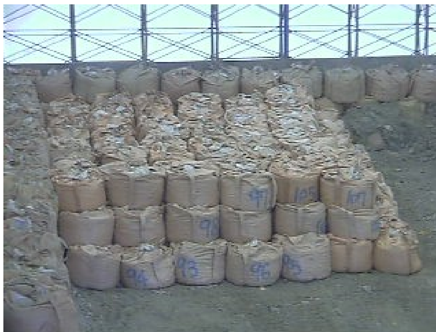
一時保管エリアA(3月28日撮影)