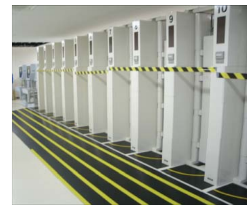
<入退域管理棟内部>