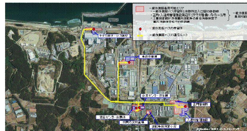
<一般作業服着用可能エリア>