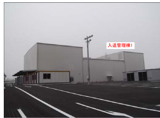
<①入退域管理棟外観>