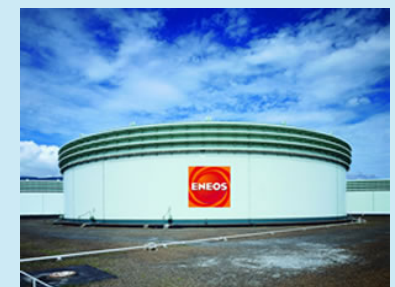
JX喜入石油基地（鹿児島県）