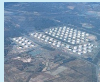
苫小牧東部国家石油備蓄基地（北海道）