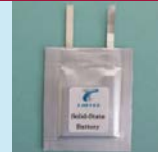
例：シート成型型標準電池モデル