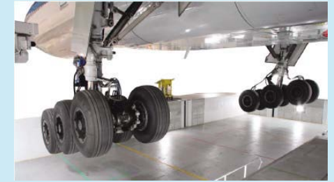
次世代降着システム