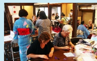
文化の体験イベント