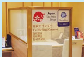
免税対応設備を備えた施設

地域と連携し、専門家の指導を受けて実施する免税対応施設やWi-Fi設備、ゲストハウスの整備、店舗の多言語対応化といった、インバウンドや観光等の新たな需要を効果的に取り込むために必要な商店街の環境整備について、消費の喚起につながる実効性のある取組を支援します。