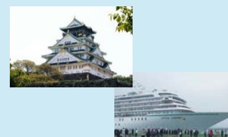
観光資源等と連携した取組