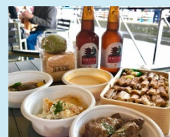
地元食材を活用した取組

地域と連携し、専門家の指導を受けて実施する地元グルメや食材の活用、茶道や料理等の日本文化の体験、世界遺産や産業観光と連携したイベントといった、インバウンドや観光等の新たな需要を効果的に取り込むために必要な商店街の取組について、消費の喚起につながる実効性のある取組を支援します。