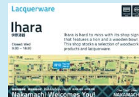
店舗前の多言語サイン