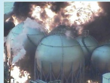
【東日本大震災時に発生した大規模火災の様子】