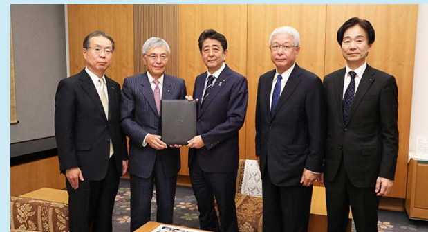
2018年11月8日、安倍晋三総理大臣に 2018年ABACの「APEC首脳への提言書」を提出。