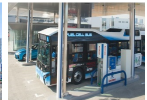
FCVバス対応 水素ステーション