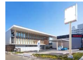
コンビニ併設型 水素ステーション