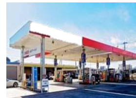
SS併設型 水素ステーション