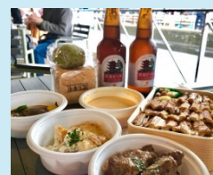
地元食材を活用した取組

地域と連携し、専門家の指導を受けて実施する地元グルメPR、茶道や料理等の日本文化の体験、世界遺産と連携したイベントなど、インバウンドや観光といった新たな需要を効果的に取り込むために効果的な商店街等の取組について、消費喚起につながる実効性のある取組等を支援します。