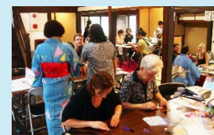
文化の体験イベント