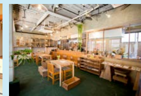
(画像出所) MIDOLINO 資料 シェアキッチンの整備