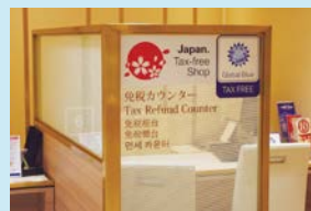
免税対応設備を備えた施設

地域と連携し、専門家の指導を受けて実施する免税対応施設やWi-Fi設備、ゲストハウスやシェアキッチン・オフィスの整備など、インバウンドや観光といった新たな需要を効果的に取り込むために効果的な商店街等の環境整備について、消費の喚起につながる実効性のある取組等を支援します。