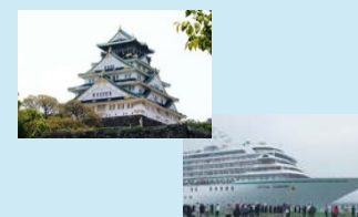
観光資源等と連携した取組