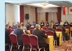
（専門家が講演するセミナーの開催）