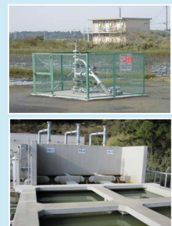
水溶性天然ガス生産設備