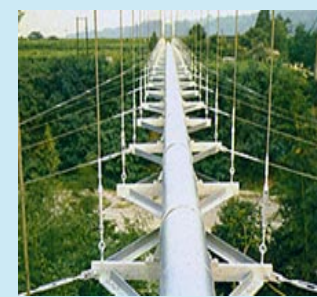
天然ガスパイプライン