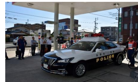
石油組合における災害時対応研修・実地訓練、パトカーへの緊急給油訓練