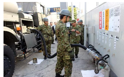
自衛隊を交えた石油組合と地元自治体の総合防災訓練