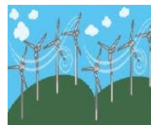
風車における 風況の予測