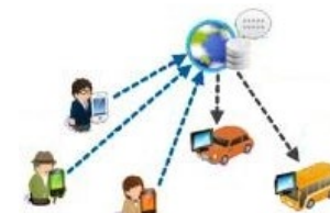
オンデマンド 乗り合い交通