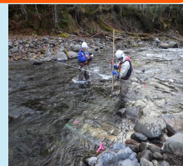
流量調査・測量作業

民間事業者や地方公共団体が行う、新たな水力発電事業の実施にあたり必要となる調査、設計及び流量観測等に必要となる機器、作業道整備等に資する費用を支援します。また、水力発電事業の実施にあたり、事業者が立地地域との課題解決や、共生を図るために実施する事業を支援するとともに、国内外の技術情報の収集を実施します。