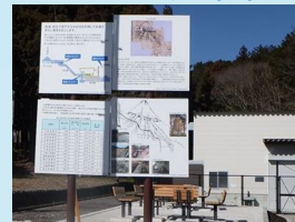
地域の理解促進に係る環境整備