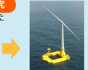
低コスト浮体式洋上風力発電システム実証機