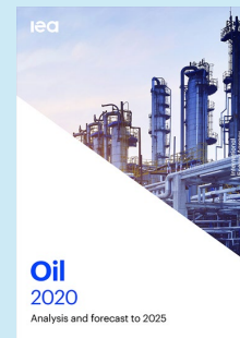
Market Report Series: Oil 2020