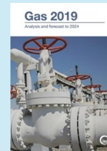
Market Report Series: Gas 2019