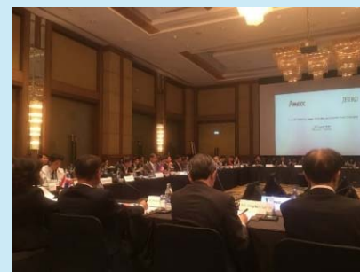
メコン産業開発ビジョン2.0の策定（東西回廊WG）