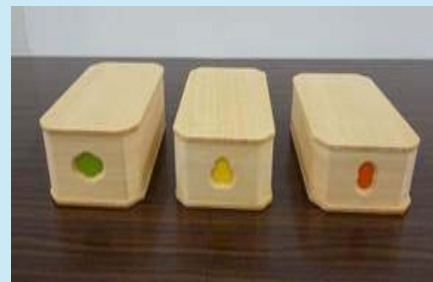
お弁当箱 【尾張仏具】