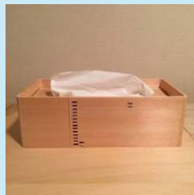
ティッシュボックス 【飛騨春慶】

全国の伝統的工芸品の作り手と販路を持つプロデューサーとのマッチングによる現代のニーズに合った新商品開発・成果発表展示会を実施します。