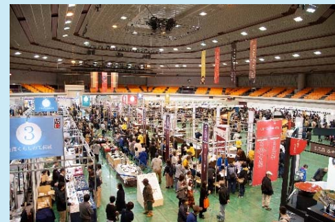
【全国大会（岩手）での出展の様子】