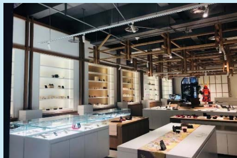
【重慶のショールームの様子】

海外展開拠点としてフランス・パリや中国・重慶に常設のショールームを開設し、ブランディングや市場調査を実施するほか、全国大会等を通じて事業者の海外展開や販路開拓を支援します。