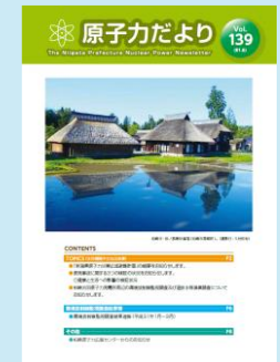
自治体作成の原子力広報誌