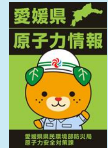
自治体が提供するスマートフォンアプリ