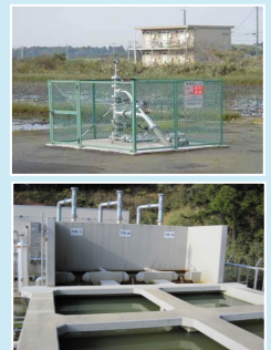
水溶性天然ガス生産設備