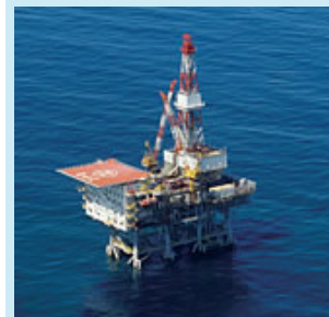
海上プラットフォーム