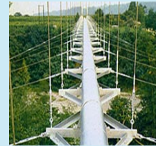
天然ガスパイプライン