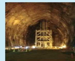
波方基地 (上：地上設備、 下：地下岩盤貯槽)