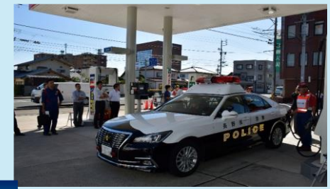
災害対応車両への緊急給油訓練