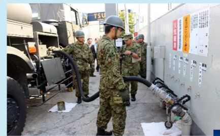
自衛隊を交えた石油組合と地元自治体の総合防災訓練