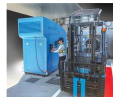
小規模 水素ステーション