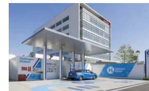
中規模 水素ステーション