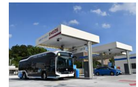
大規模 水素ステーション