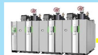
エネルギー消費効率の 高いボイラー