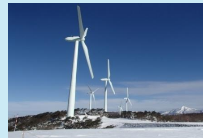
再生可能エネルギー発電設備