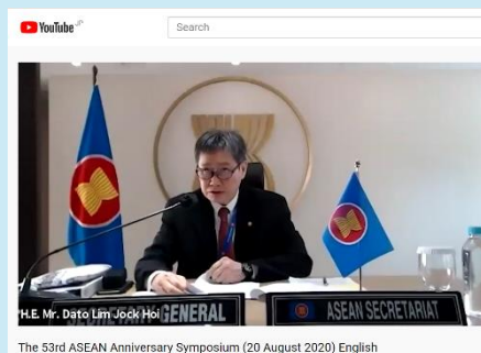
ASEAN設立53周年記念シンポジウム 『コロナの向こうに—新しい日常へ—』オ ンライン、リムASEAN事務総長による 基調講演