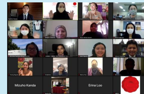
女性起業家交流プログラム (日ASEAN女性起業家リネージュ プログラム、AJWELP)