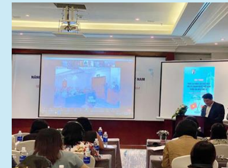
ベトナムでの輸出能力強化ワーク ショップ