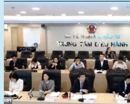
ASEAN諸国高官と日本の投資家との ハイレベル政策対話 (ベトナム投資法・企業法改正ウェビナー)