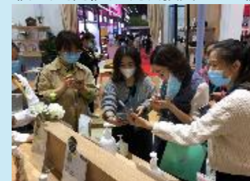
《オンラインツールを組み合わせた中国での展示会の実施》