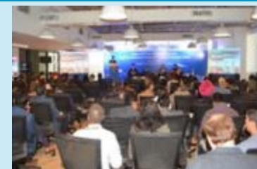
《インドで開催した対日投資セミナー》