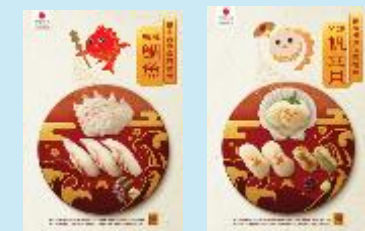
《日本産水産物プロモーションの実施》