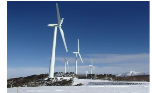
再生可能エネルギー発電設備