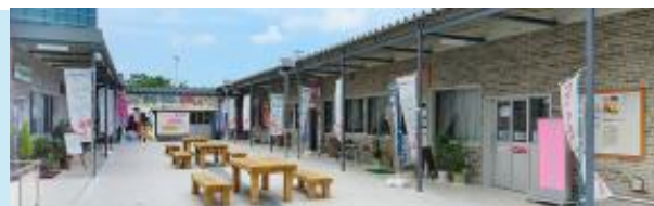
中小機構が設置した仮設施設