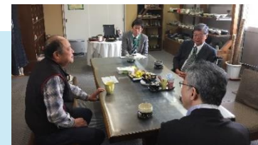
被災事業者への個別訪問