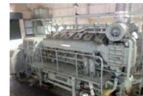
例：自家用発電機の整備