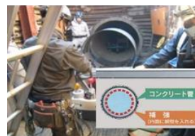
例：管路の耐震補強