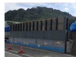
例：施設のかさ上げ