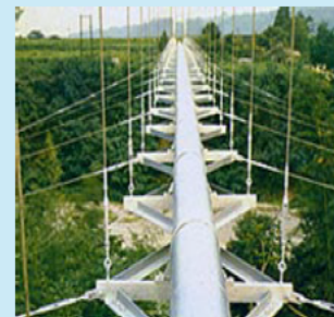
天然ガスパイプライン