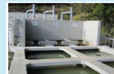
水溶性天然ガス生産設備