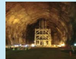
波方基地 (上：地上設備、 下：地下岩盤貯槽)