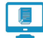
テキストマイニング 画像認識ソフトウェア等