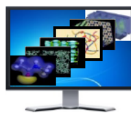
シミュレーション設計