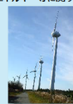
例：風力発電設備の工事計画の審査体制の見直し