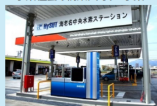
例：水素ステーションにおける遠隔無人に係る技術基準の検討