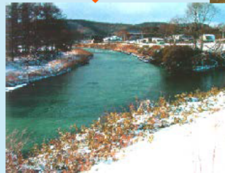
対策を講じた河川 （現在）