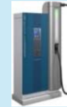
急速充電器・ 超高速充電器