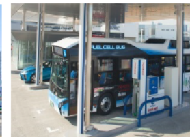
FCVバス対応 水素ステーション