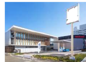
コンビニ併設型 水素ステーション