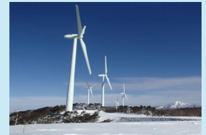
再生可能エネルギー発電設備