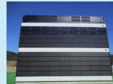
ビル壁面に太陽光パネルを設置した例