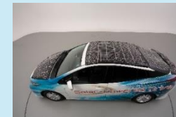
狭い面積でも十分な駆動力が得られる車載用太陽電池モジュール