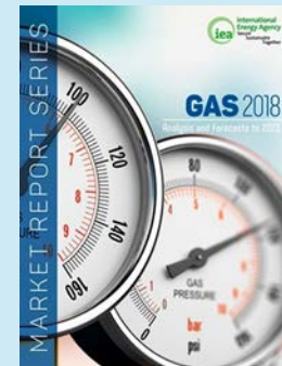
Market Report Series: Gas 2018