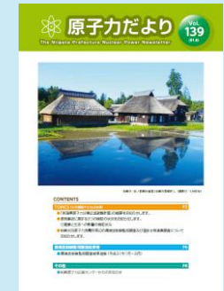
自治体作成の原子力広報誌