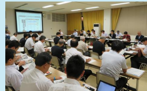
地域住民、行政、電力事業者及び科学者等の双方向の対話