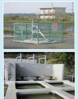
水溶性天然ガス生産設備