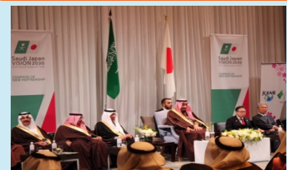
本邦企業のビジネス展開を目的としたフォーラムの開催（サウジアラビア）