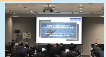
投資環境等に関するセミナー開催（ロシア）