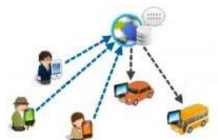
オンデマンド 乗り合い交通