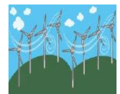
風車における 風況の予測